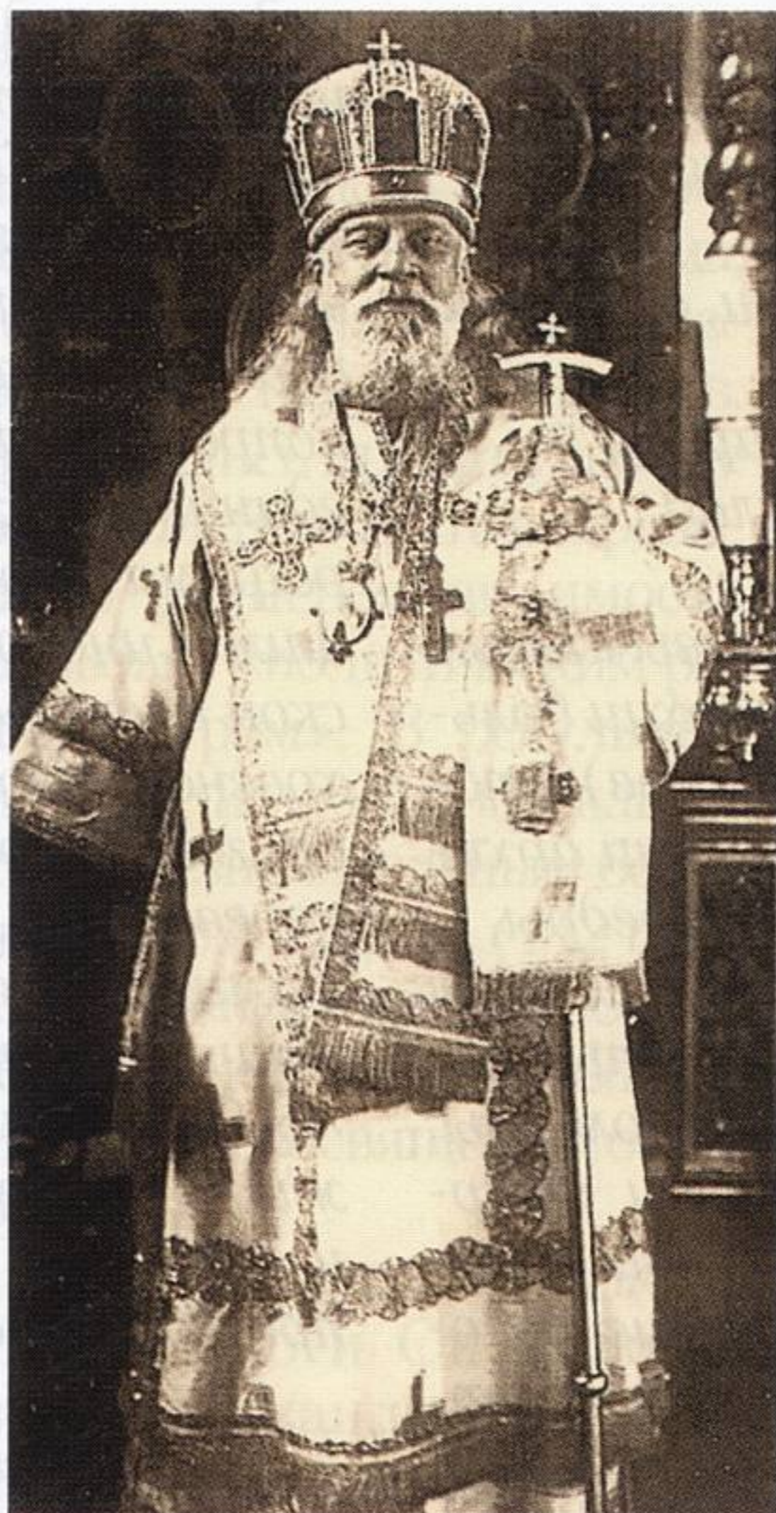
Митрополит Ленинградский и Гдовский Серафим

Несмотря на то, что Святейшим Правительствующим Синодом было вынесено определение о возвращении архиепископа Серафима в Тверскую епархию, он уже не мог вернуться в Тверь, поскольку епархиальный дом был захвачен большевиками, а его имущество и запасы реквизированы. Позднее в письме митрополиту Арсению (Стадницкому) от 9 апреля 1918 года Владыка Серафим так описывал происходившие в 1917 году в Тверской епархии события: «Я не находил возможным уйти из Твери, потому что это значило бы предать ревностное и честное духовенство на расправу партии, действующей из личных выгод, вместе с большевиками. Не находил также возможным и принципиально, дабы не подчиниться незаконной власти, овладевшей даже епархиальным управлением. Нельзя же, чтобы их интрига и требование повлияли на меня и высшую церковную власть и мы исполнили их злое желание, ни на чем не основанное. Но, конечно, я глубоко оскорблен епархией после происшедшего и вовремя не остановленного духовенством, а также народом, мое сердце оторвалось. Оставаться на такой кафедре мне нежелательно. Нижний Новгород имеет только ту привлекательность для меня, что в этой епархии, мне хорошо известной, Серафимо-Дивеевский монастырь, где приготовлена моя могила, и я уже столько потрудился в деле прославления преподобного Серафима. Есть смысл и основание