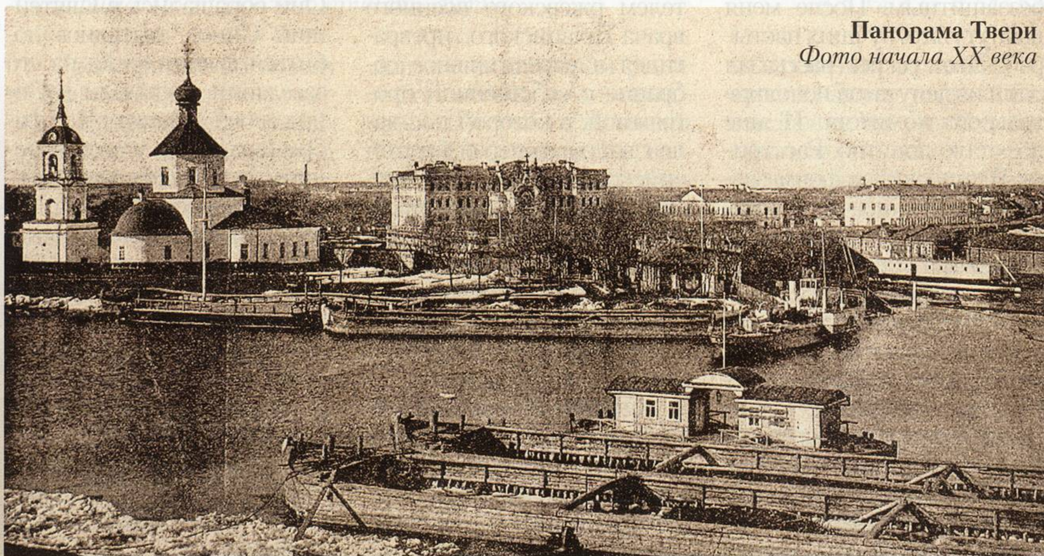
Панорама Твери Фото начала XX века

В письме обер-прокурору В. Н. Львову от 23 апреля