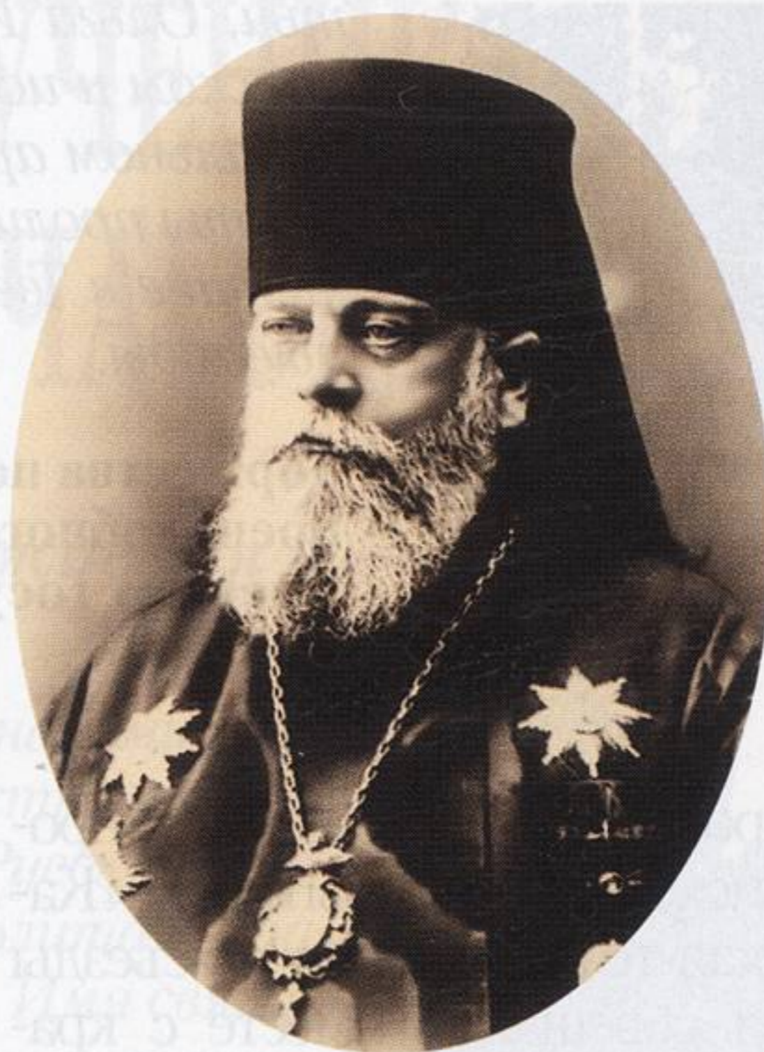
Архиепископ Кишиневский и Хотинский Серафим 1912 год

Враги Православной Церкви применяли всевозможные средства, направленные на удаление «нелояльных» иерархов с епископских кафедр, одобряли произвол при проведении Епархиальных съездов, опираясь при этом на нижние слои общества; привлекали на свою сторону (путем запугивания) викарных епископов, радикально настроенное духовенство, псаломщиков; игнорировали мнения приходских и благочиннических собраний, мнение монастырей, выраженное в письмах, телеграммах, протоколах собраний; захватывали епархиальные дома, имущество, припасы. Все эти приемы использовались и в отношении Владыки Серафима. В донесении Святейшему Правительствующему Синоду 27 апреля 1917 года Владыка Серафим описывал ситуацию следующим образом: «В день моего возвращения в Тверь из Петрограда после переворота я созвал пастырское собрание для обсуждения создавшегося положения, а на следующий вечер собрал заседание всего духовенства с церковными старостами, на котором и было определено созвать экстренный Епархиальный съезд 20-е апреля... затем, дабы пойти навстречу современным, очень резким требованиям, я сделал распоряжение о производстве новых выборов: благочинных, помощников их, членов